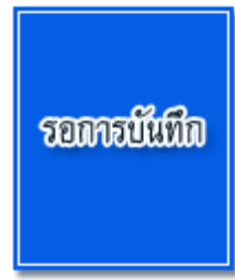
รอกกระบิ้นทีก คนงานประจำรถขยะ